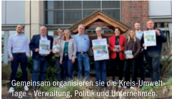
Gemeinsam organisieren sie die Kreis-Umwelt-Tage – Verwaltung, Politik und Unternehmen.

Hitzeperioden, Starkregen und zunehmende Trockenheit stellen auch die Städte und Gemeinden im Kreis Pinneberg vor große Herausforderungen. Neben dem Klimaschutz ist daher die Anpassung an die Folgen des Klimawandels zu einer wichtigen Aufgabe geworden. Vor diesem Hintergrund stehen die Kreis-Umwelt-Tage 2026 noch bis