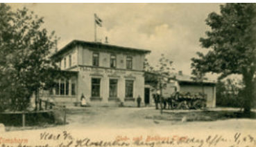
17. Juni: Club- und Ballhaus Tivoli mit Pferdewagen

Die Entwicklung Elmshorns von den Zeiten des kleinen Kirchdorfs in gräflicher Zeit bis hin zum heutigen Stadtumbau soll in einer zweistündigen Führung nachgespürt werden und die jeweiligen Epochen anhand markanter, im Stadtbild noch sichtbarer Gebäude und Strukturen illus-