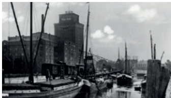
19. August: Hafen Elmshorn

Krückkau bestimmte jahrhundertlang das Leben und Arbeiten im Ort. Auf diesem Rundgang durch den